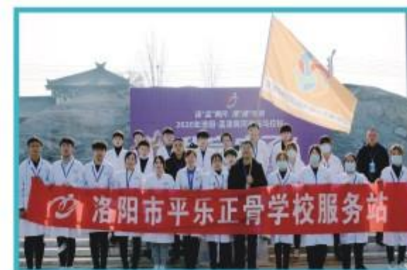
学校组织志愿者参加孟津黄河半程马拉松