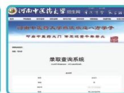
专升本考入河南中医药大学