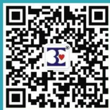
平乐正骨公众号欢迎关注