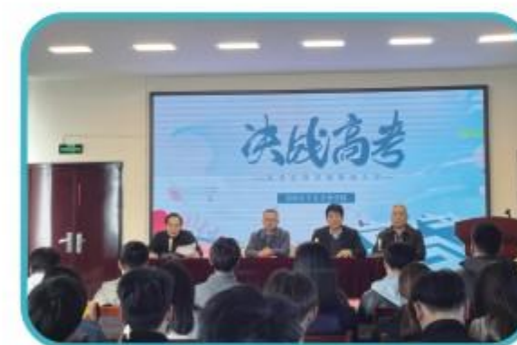
高考百日冲刺誓师大会

学校以“为党育人、为国育才，培养有社会担当的人，培养有专业才能的人”为培养目标，以“医德高尚、医术精湛”为育人宗旨，以“专业立校、质量强校、特色兴校”为办学理念，以“理论是基础，实践是关键，技能是根本”为教学原则，以“传承平乐郭氏正骨传统手法和中医用药，手法与手术并举，理论与实践结合”为主要教学内容。